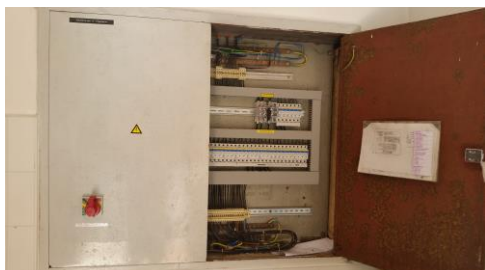
Pripravila: Mateja Urleb, vodja pralnice